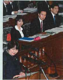
3月30日 本会議 答弁者席(写真右)

子どもの未来が家庭の経済力で左右されてはなりません。野党6党で提案した「子どもの生活底上げ法案」は、児童扶養手当増額、生活保護世帯の子どもが保護を受けつつ大学進学できるよう改善すること、実態に見合わない生活保護切り下げの見直しなどを盛り込んでいます。私も法案提案者の一人として、はじめて本会議で答弁者となりました。