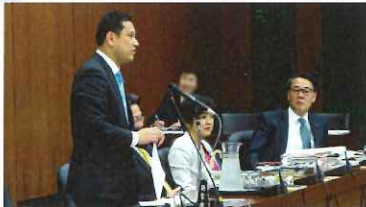
財務金融委員会での審議も「野党共闘」で

財務省の福田前事務次官のセクハラをめぐり、麻生財務大臣が国会で、福田氏が「はめられた可能性もある」と発言。私は、その日の午後、セクハラ行為を認定している財務省の立場とも異なると追及、麻生大臣は発言を撤回しました。さらに、麻生大臣こそセクハラ防止の研修を受け、被害女性に謝罪すべきだと迫りました。