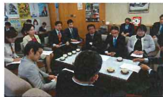
1月24日 党議員団で厚労副大臣に申し入れ