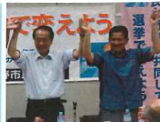
市民と野党の共同を前にすすめます

膨張した防衛省予算を福祉・教育・暮らしに振り向けさせるためにも力を尽くしていきたいと思えます。