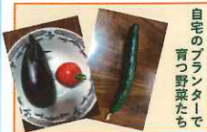
自宅のプランターで育つ野菜たち