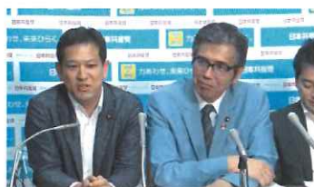
内部文書を公表する森友・加計問題追及チーム記者会見はニュース等で報道された 6月5日

わが党が独自に入手した文書で、政府が会計検査院や検察に圧力をかけたり、国会議員への資料提出について「政権との関係でデメリットも考えながら対応する必要がある」、「最高裁まで争う覚悟で非公表とする」と協議していたことが明らかになりました。また、交渉記録も改ざんされていたことを国会で暴露しました。政権を守るために国会と国民を欺きつづけるのはやめ、ウソのない正直な政治を実現すべきです。