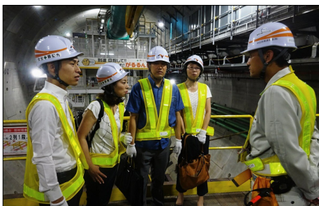
外環道大深度地下トンネル工事

オスプレイの無灯火での夜間飛行訓練や日米合同委員会の合意違反である基地外でのヘリモードでの飛行などの実態を告発し、政府として実態を把握するよう迫りました。