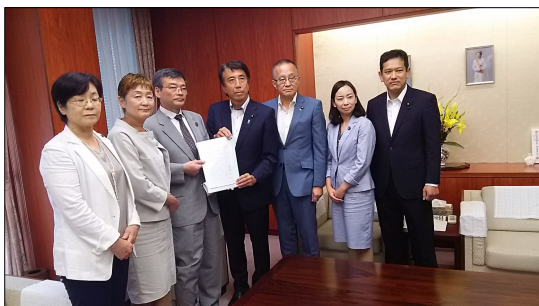
「豊洲市場を認可するな」と農水大臣に要請

南北首脳会談、米朝首脳会談で、朝鮮半島情勢は、緊張緩和へとすすんでいます。イージスアショアではなく、医療、介護、年金、子育て、障害者福祉等にこそ税金は優先して使うべきです。