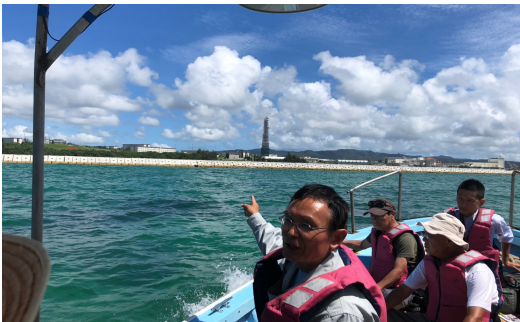
辺野古護岸工事の様子 2018. 8. 18

翁長知事の志をつぐ知事を誕生させたい。私も沖縄で訴えてきました。そして、都内の各地のつどいや街頭からも沖縄のお知り合いに支持を広げてほしいと訴えています。