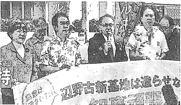
オール沖縄会議が開いた集会で決議表明する玉城デニー知事(中央)＝10月30日、那覇市